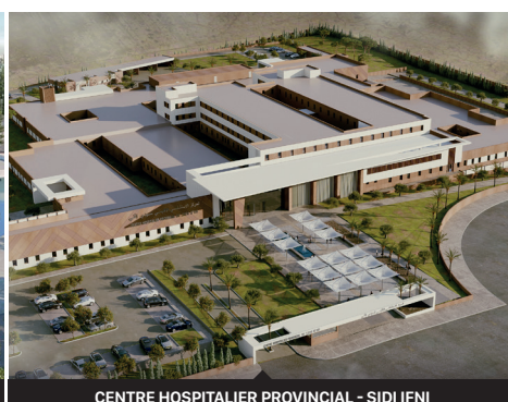
CENTRE HOSPITALIER PROVINCIAL - SIDI IFNI