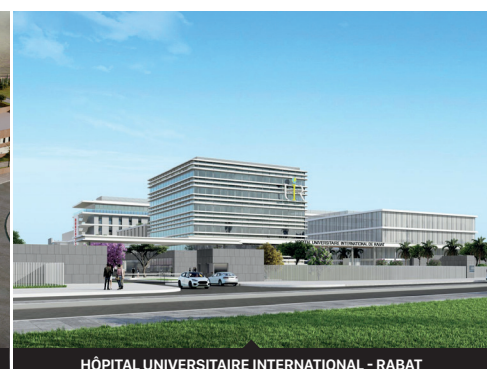
HÔPITAL UNIVERSITAIRE INTERNATIONAL - RABAT