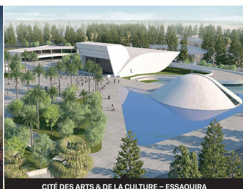
CITÉ DES ARTS & DE LA CULTURE - ESSAOUIRA