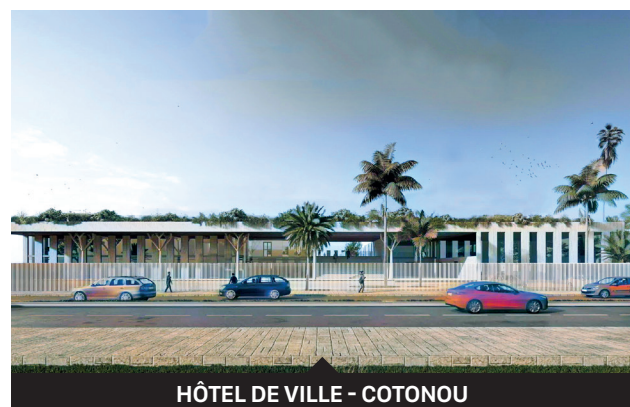
HÔTEL DE VILLE - COTONOU